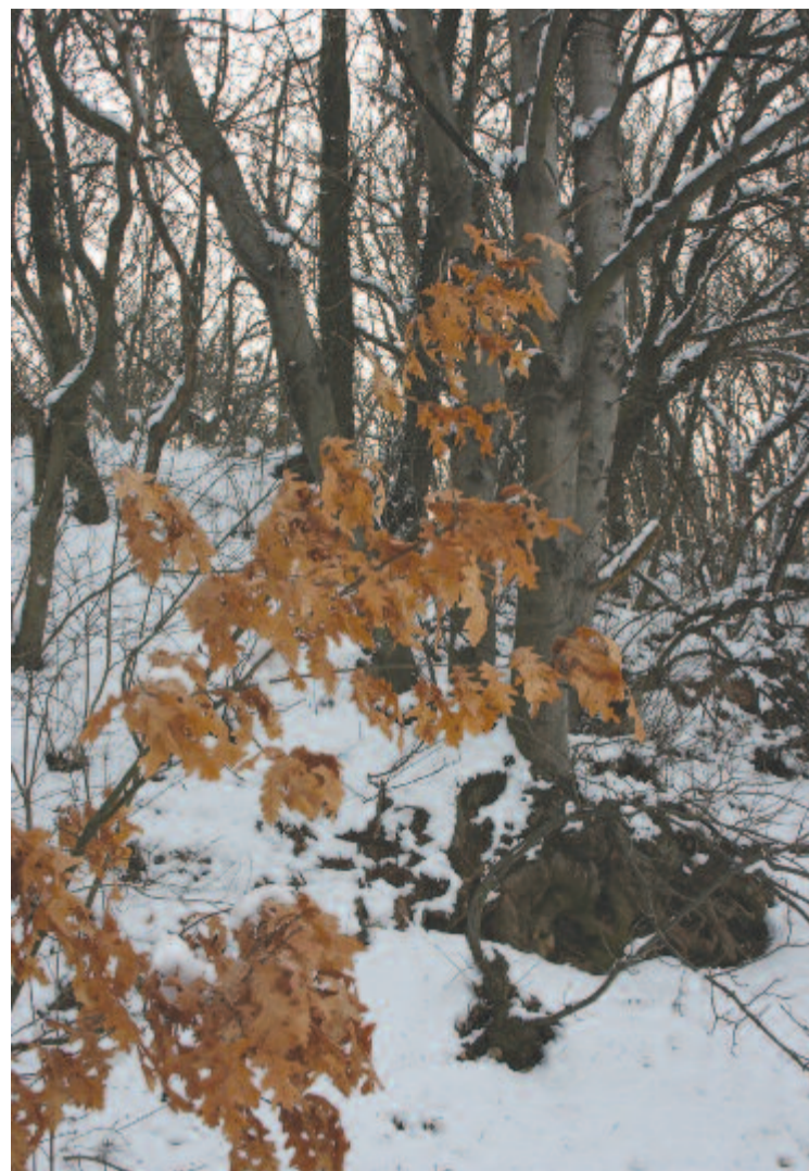
A homályból előhajol egy rozsdalevelű fa

De hogy mindezek az események mennyiben alakították világunkat, viszonyunkat a minket körülvevő természeti világgal – ellenségessé avagy gyönyörűvé? Eldöntését rád bízom, kedves Olvasóm.