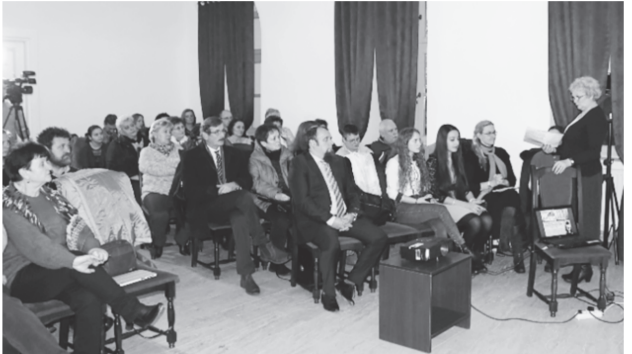
A kisvárosban minden év január 22-én megünnepelik a magyar kultúrát