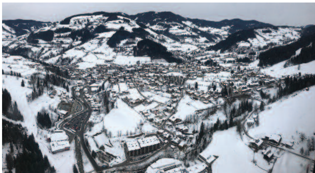
Míg hó borítja földjeinket, addig nem is romolhatunk meg

(...) A széles, szenes göröngyök felett egy kevés könnyű hamu remeg. Csendes vidék. A lég finom üvegét megkarcolja pár hegyes cserjeág.